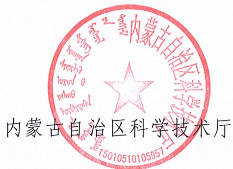
内蒙古自治区科学技术厅