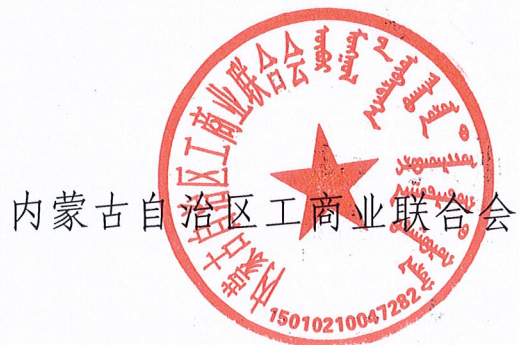
内蒙古自治区工商业联合会