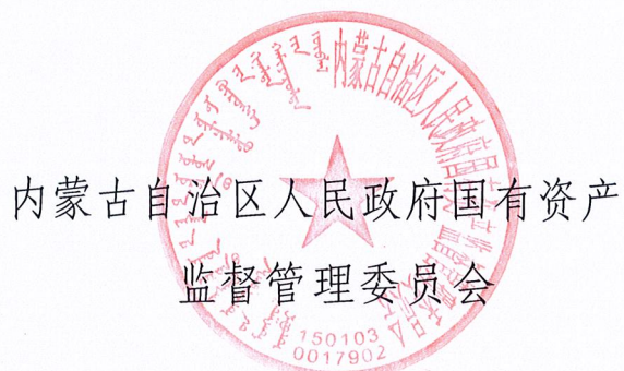
内蒙古自治区人民政府国有资产 监督管理委员会