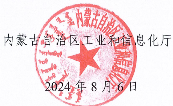
内蒙古自治区工业和信息化厅