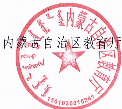
内蒙古自治区教育厅