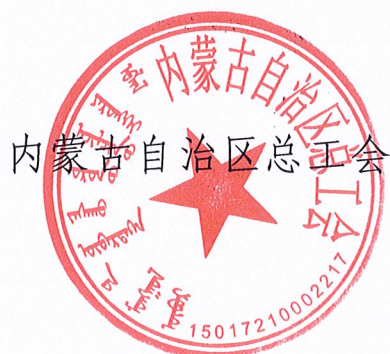
内蒙古自治区总工会